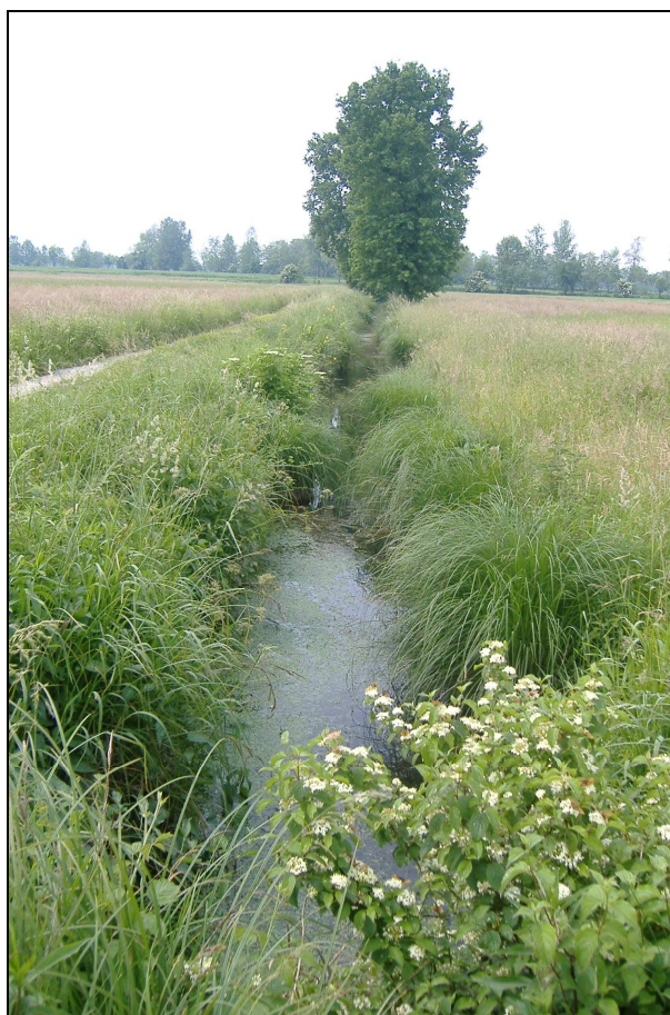
Particolare del corso d'acqua a SW di C.na Vittoria

Breve descrizione: la Sorgiva di C.na Vittoria è alimentata da numerosi fenomeni sorgentizi (sorgenti di terrazzo) a valle del ripiano alluvionale più antico e si sviluppa per poco più di 1 km con direzione SW-NE fino alla sua foce nel Negroli (reticolo di competenza del Consorzio Muzza Bassa Lodigiana).