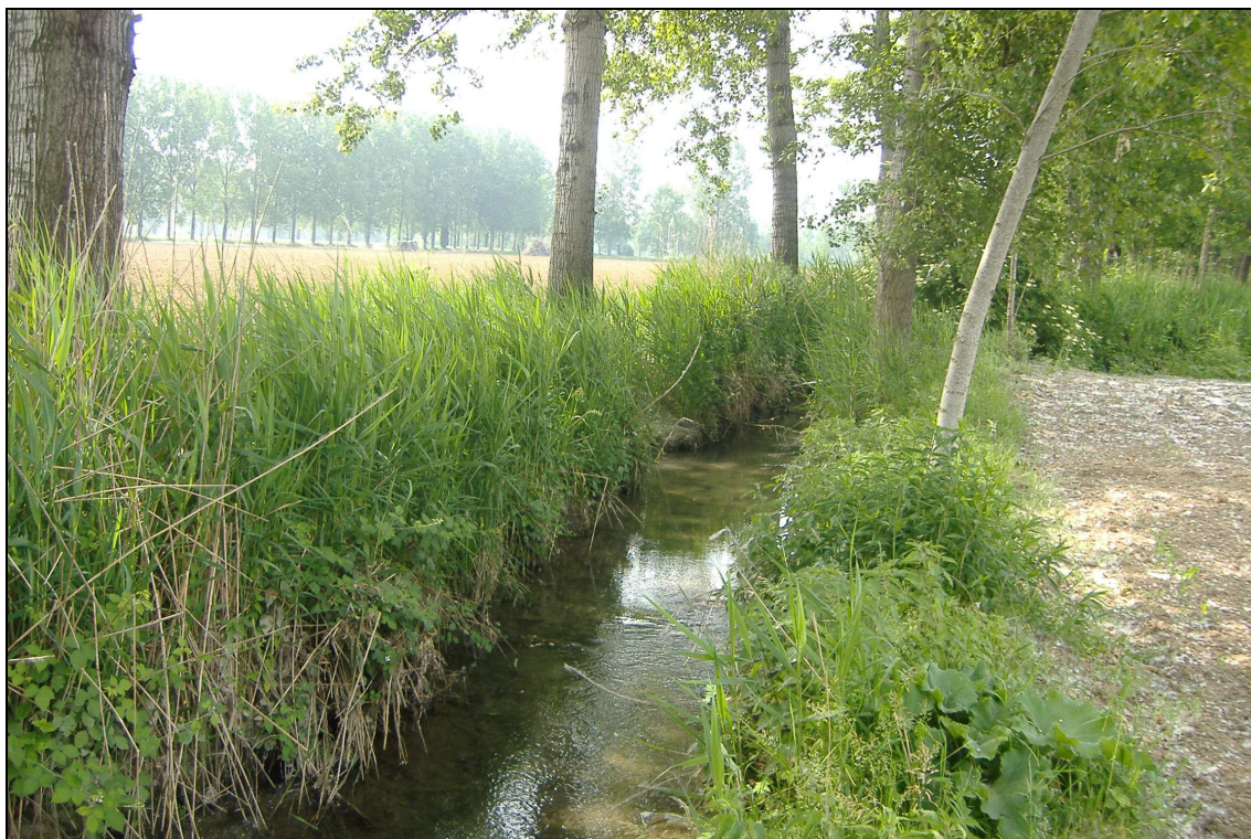
Particolare del corso d'acqua in prossimità della foce nel Negroli

Breve descrizione: il corso d'acqua nasce da alcuni fenomeni sorgentizi al piede della scarpata morfologica principale e si sviluppa per circa 1,6 km con direzione prevalente SW-NE per sfociare nel Negroli (reticolo di competenza del Consorzio Muzza Bassa Lodigiana).