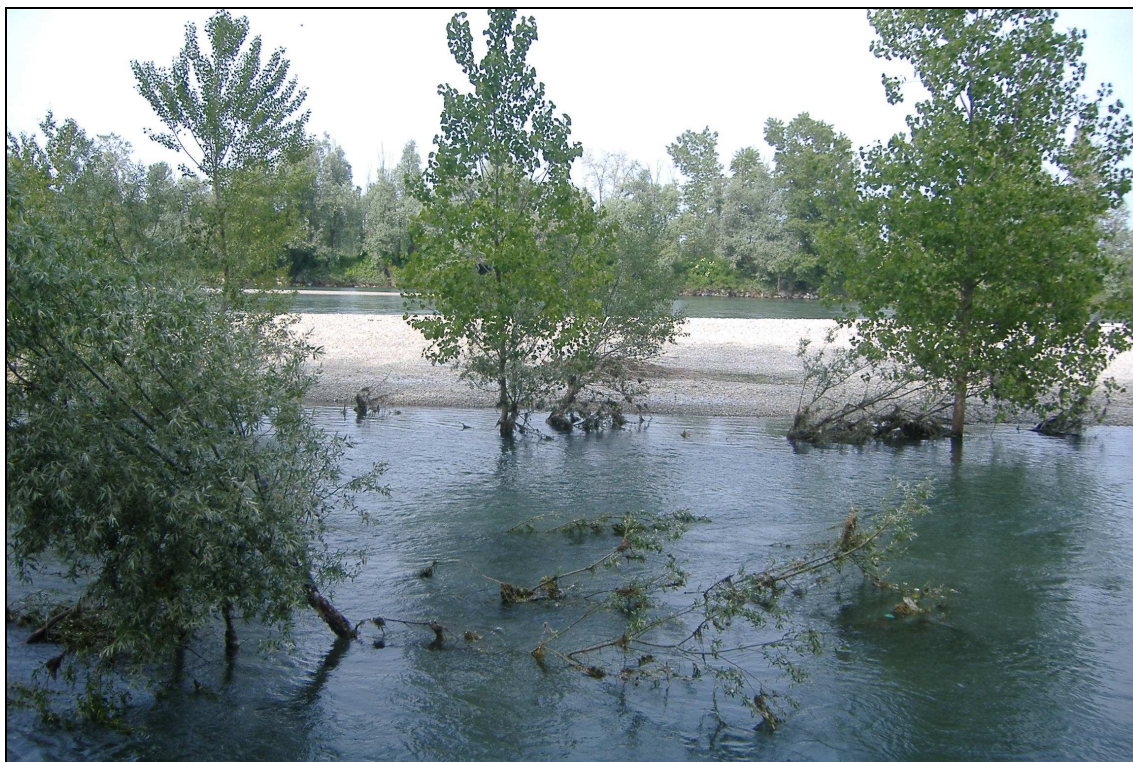
La foce del Colatore Adda Morta in Adda

Breve descrizione: il Colatore della Morta presenta un breve percorso (poco più di 1 km di lunghezza) e viene alimentato dal drenaggio della lanca di C.na Zerbaglia, caratteristica depressione meandriforme con falda sub-affiorante (testimone di un antico tracciato dell'Adda).