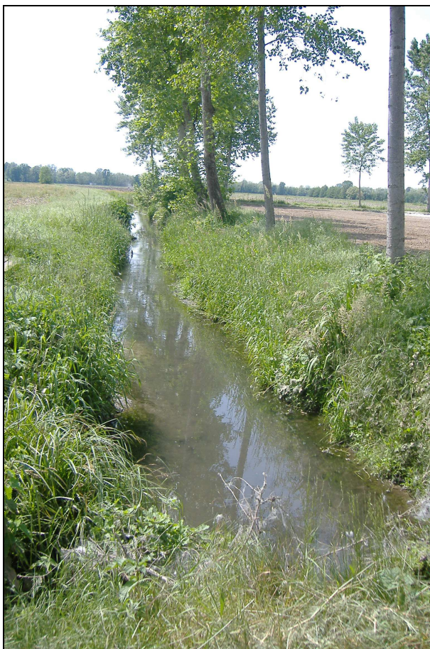
Sorgile del Menabò a NE di C.na S. Lorenzo

Breve descrizione: il Sorgile del Menabò si sviluppa per circa 1,8 km con direzione SW-NE sino a sfociare nel Rebecchino (reticolo di competenza del Consorzio Muzza Bassa Lodigiana). Il corso d'acqua nasce da fenomeni sorgentizi al piede della scarpata morfologica principale a SW di C.na S. Lorenzo.